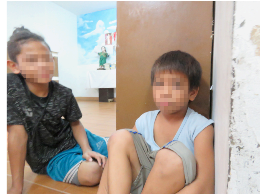
oben: Kinder werden wegen Bagatelldelikten - wie des Verstoßes gegen die Ausgangssperre - inhaftiert.