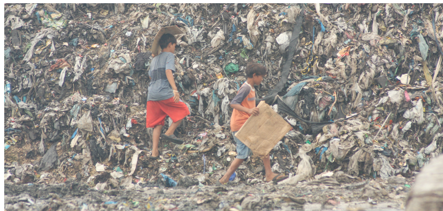
unten: Stundenlang durchsuchen Kinder Müllhalden nach recycelbaren Abfällen, um ein paar Pesos zu verdienen.

"Die meisten Straßenkinder sind Analphabeten. Ohne Anreiz, Geld oder Unterstützung und Ermutigung zum Lernen haben sie die Grundschule abgebrochen. Sie schließen sich zu ihrem eigenen Schutz Straßenbanden an und verwenden Industriekleber als Beruhigungsmittel, das den Geist und die Stimmung verändert. Sie verkaufen Plastiktüten, Zeitungen und Blumen oder betteln für ein Syndikat. Viele werden von Zuhältern kontrolliert und an Sextouristen verkauft oder in ein Bordell gebracht. Straßenkinder sind die Ärmsten der Armen; sie sind die Verletzlichsten und Schwächsten und werden, wenn ihnen nicht geholfen wird, die HIV/AIDS-Opfer der Zukunft sein. Sie werden zur Prostitution mit ausländischen Sextouristen gezwungen. Sie könnten leicht zu Kriminellen oder sogar Terroristen werden, die sich über die Welt der Erwachsenen ärgern, die ihnen das Leben in dem schlimmsten Elend gab, das man sich vorstellen kann."